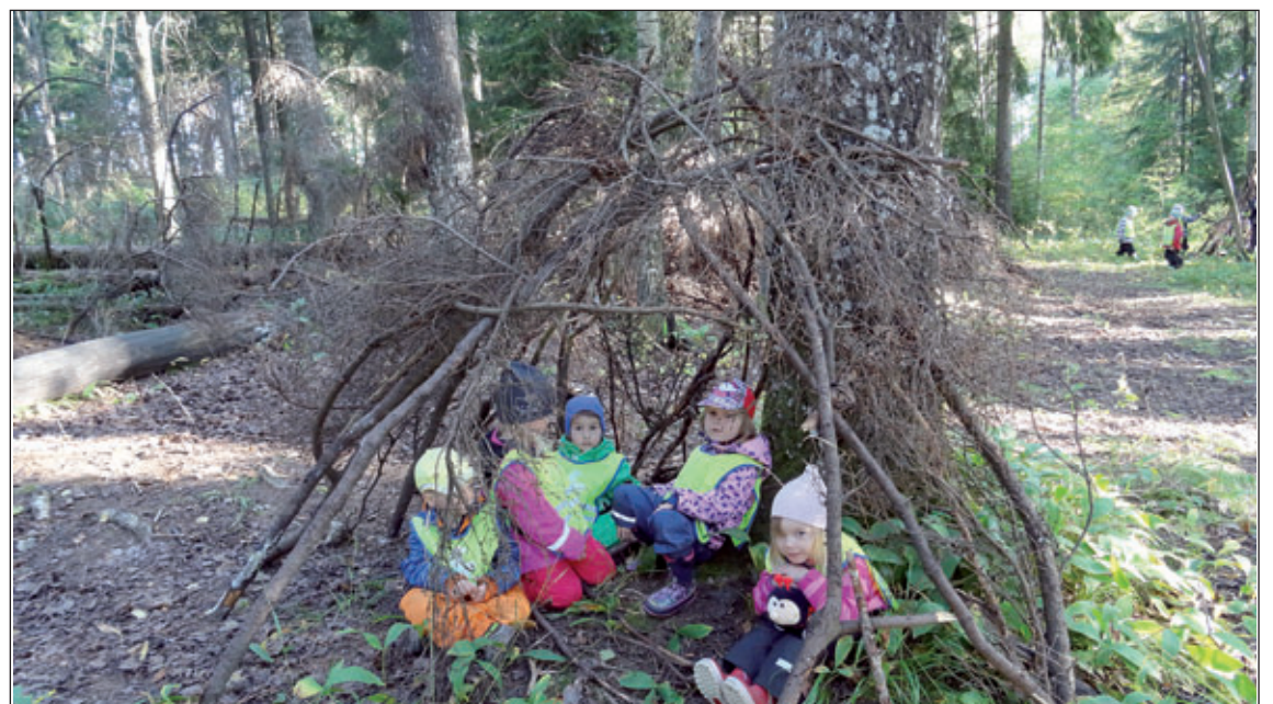
Vi byggde en koja i Mulleskogen.

www.lekskolansockan.fi ni hittar oss även på facebook