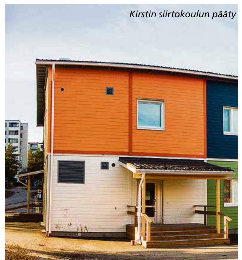
Kirstin siirtokoulun pääty

http://espoo04.hosting.documenta.fi/cgi/DREQUEST.PHP?page=meeting_frames