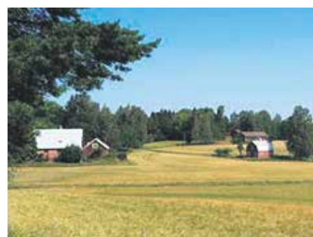
Söderskog, kuva: Esko Uotila

Toimintaa järjestävät: SPR Espoon osastot yhteistyössä Espoon kaupunki