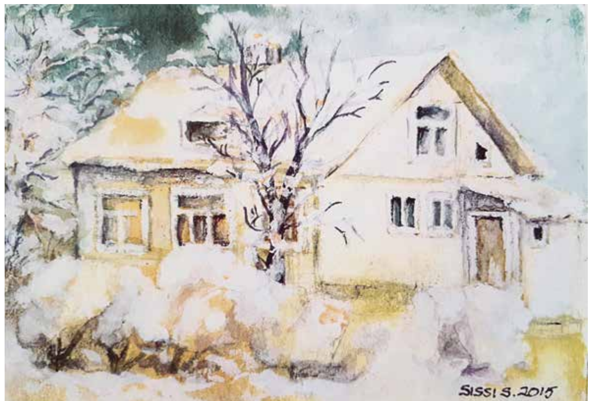
Kirstin tilan päärakennus.