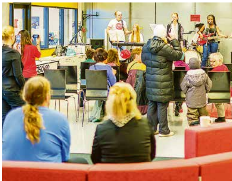
Nuoris- ja asukastila Sentteri

Kirstin koulu on kokenut vuosikymmenten aikana jatkuvasti muutoksia. Ensimmäinen koulurakennus tontilla oli vuonna 1973 valmistunut Suvelan kansakoulu, korttelikoulu. Vuonna 1977 rakennettiin uusi koulurakennus ja peruskoulun myötä Suvelan kansakoulusta tuli Kirstin koulu, joka käsitti ala-asteen ja yläasteesta Suvelan koulu.