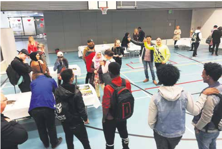
Kotiseutuliiton ja kaupunginosayhdistysten edustajat tapaavat opiskelijoita Omnian ammattiopistolla 8.5.2019.