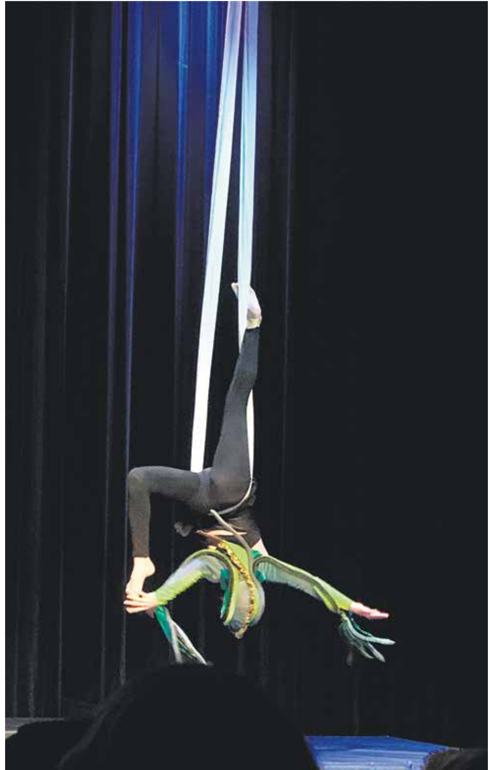
Merihirviön oma soolo.

Suomessa sirkustaide oli vasta ottamassa ensi askeliaan. Suurena haas-