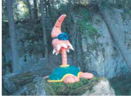
Alvar Gullichsen Throbster (1998, lasikuitu, epoksihartsi)

Taiteilijat tarjoavat teoksillaan kaupunkilaisille hauskoja, värikylläisiä kokemuksia, uusia ideoita ja myös vakavia visioita kesäisessä kaupungissa. Nelli Nion ja Ylva Holländerin värik-