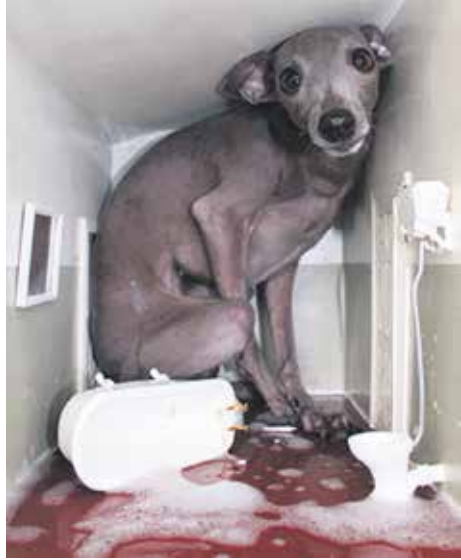
Noora Schroderus Elephant (2016, pigmenttituloste, fotosec)