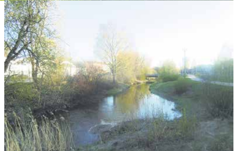
Espoonjoki Kauklahteen teollisuusalueen kohdalla

Alueen vieressä on nykyisin vanha, perinteinen kulttuuri- ja kyläympäristö radan pohjoispuolella, vanha kylänraitti, suojeltu asema ja muuta rautatiehen liittyvää rakennuskantaa, asuntoja ulkorakennuksineen. Radan eteläpuolella on palanen Espoon teollista historiaa: nykyinen Kuusakoski Oy:n jätteen vastaanottopiste, jossa oli aikoinaan tiilitehdas ja sittem-