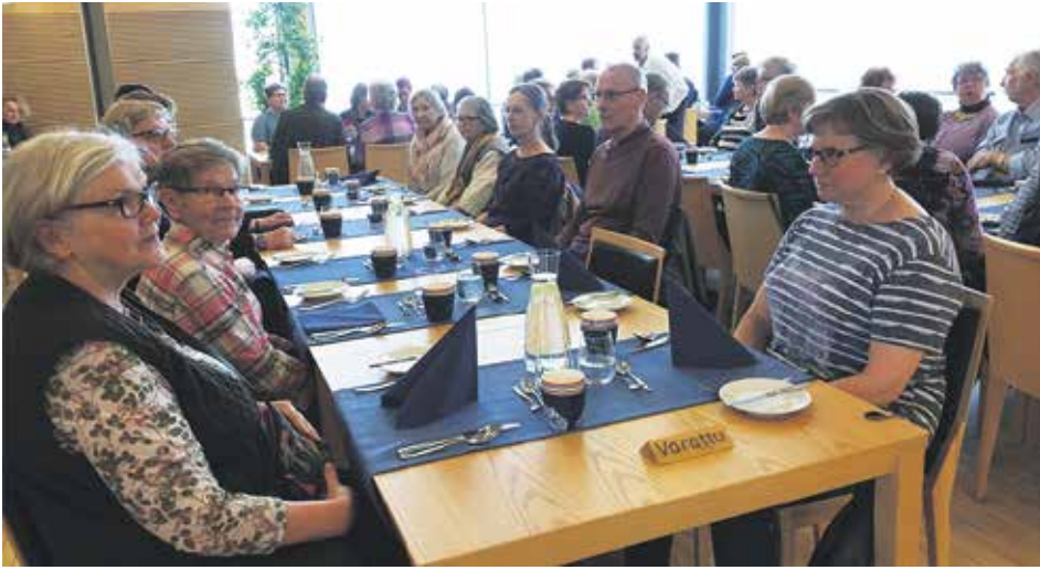
Teksti: Tuula Nordström

Säätilan äkillinen vaihtelu huhtikuussa, ilmastonmuutosta vaiko saturen kauppa? No, ei se ainakaan vaikuttanut Espoon kansallisten senioreiden alkukevään toimintaan.