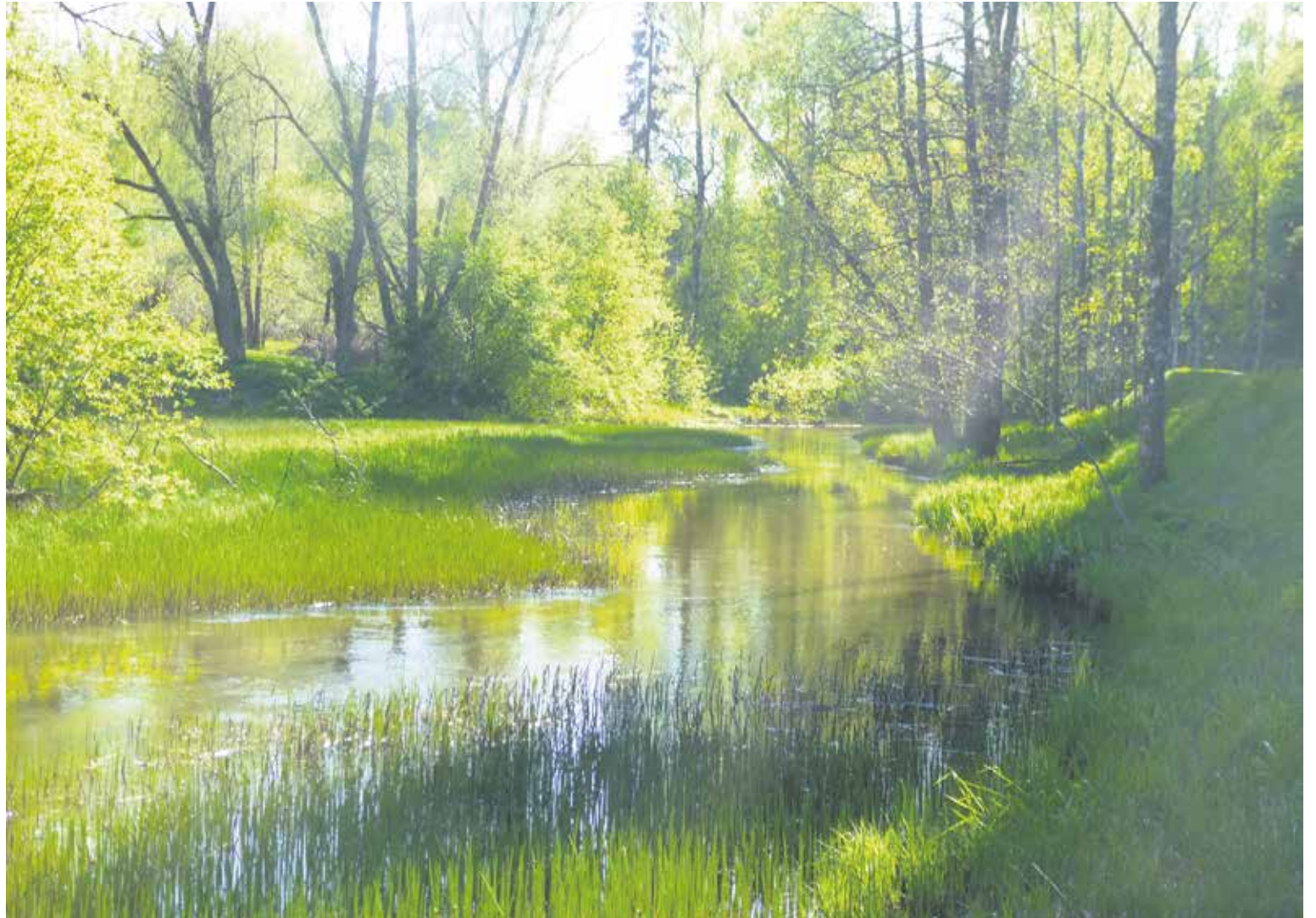
Espoonjokea Jokisillan kaava-alueella

Joen virtauksen parannustyö on joka tapauksessa iso urakka. Yhteensä läjitettävää kertyy n 13000 m 3 , joka on tarkoitus sijoittaa lähelle jokea muutamaani eri paikkaan. Suurimmat määrät kertyvä Turunväylän ja Kirkkokadun välistä sekä Mikkelän ja Kauklahteen väliseltä avoimelta pelto-osuudelta. Työtä varten on tehtävä isoja järjestelyjä, rakennettava tilapäisiä reittejä kuorma-autoille ja työkoneille, koska suurimmalla osalla jokivartta ei ole välittömässä läheisyydessä ajotietä; Espoon keskuksesta alaspäin jokivarsi on enimmäkseen peltoa. Täs-