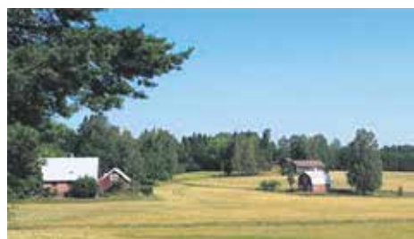
Söderskog, kuva: Esko Uotila

Maatilojen Espoo -näyttely / Utställningen Det agrara Esbo 26.2.–4.10.2020