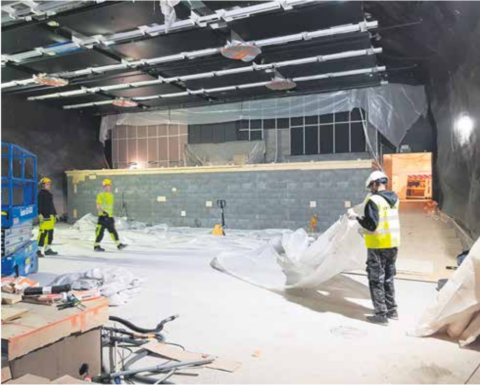
Betonityöt tulivat valmiiksi pääsiäiseksi.

Remontti on nyt loppusuoralla, ja syyskaudella Kannusalissa päästään jälleen nauttimaan elokuvista, keikoista, teatterista, koko perheen tapahtumista ja paljon muusta!