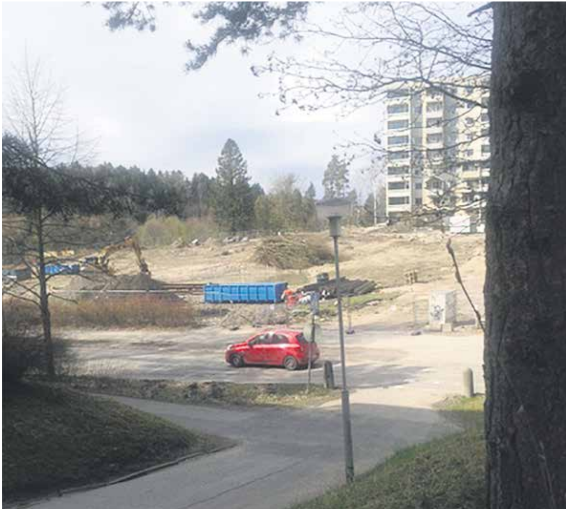
Teksti ja kuva: Seppo Holste

https://espooprodfi.oncloudos.com/cgi/DREQUEST.PHP?page=meetingitem&id=2017425469-8 https://espooprodfi.oncloudos.com/cgi/DREQUEST.PHP?page=meetingitem&id=2019465123-13 https://espooprodfi.oncloudos.com/cgi/DREQUEST.PHP?page=meetingitem&id=2020499316-16