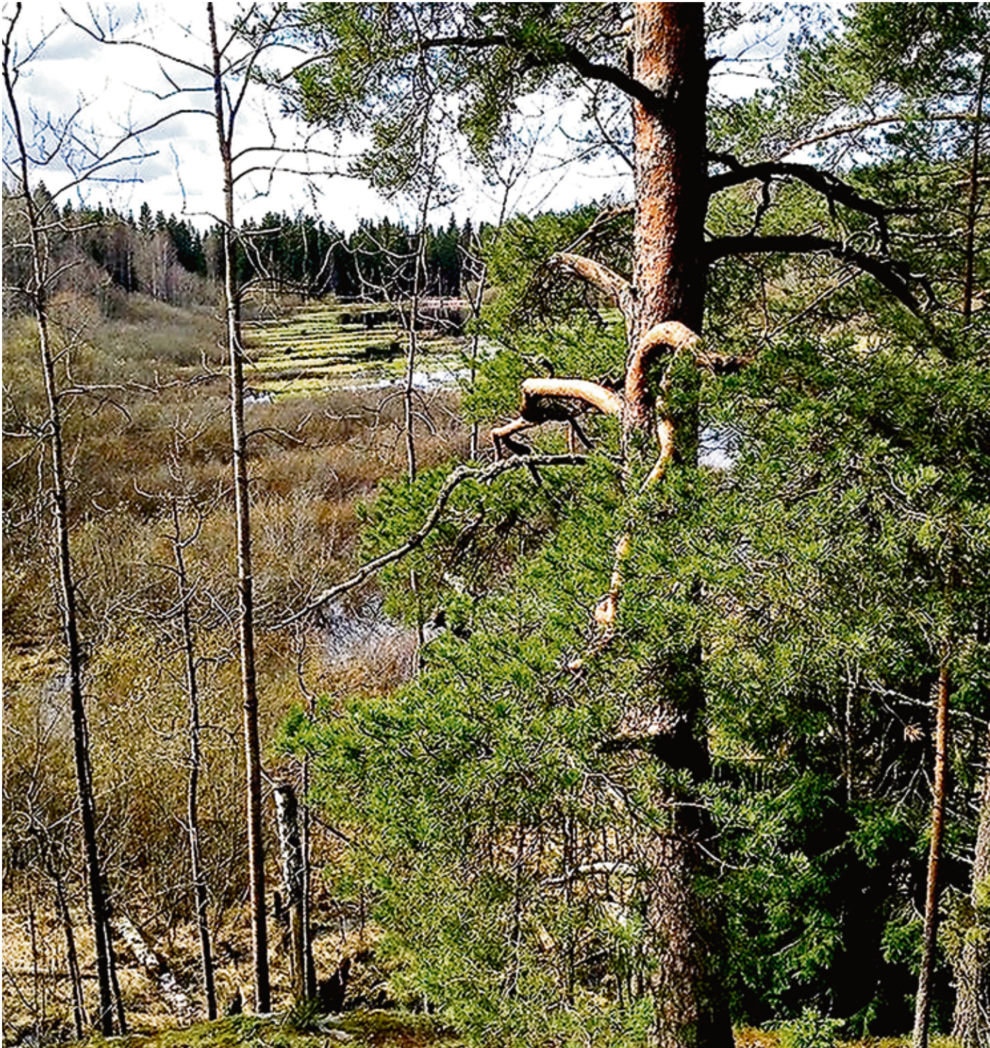
Kuva: Seppo Holste, Keskuspuisto

Kaupunginhallitus esitti kokouksessaan 14.08.2017 §58 Uudenmaan elinkeino-, liikenne- ja ympäristökeskukselle luonnonsuojelulain 24§:n mukaisten luonnonsuojelualueiden perustamista Espoon kaupungin omistamille kolmelle kohteelle Lillträskin luonnonsuojelualue 13,1 ha, Mössenkärin luonnonsuojelualue 8,5 ha ja Harmaakallio-Gråbergetin luonnonsuojelualue 50,8 ha.