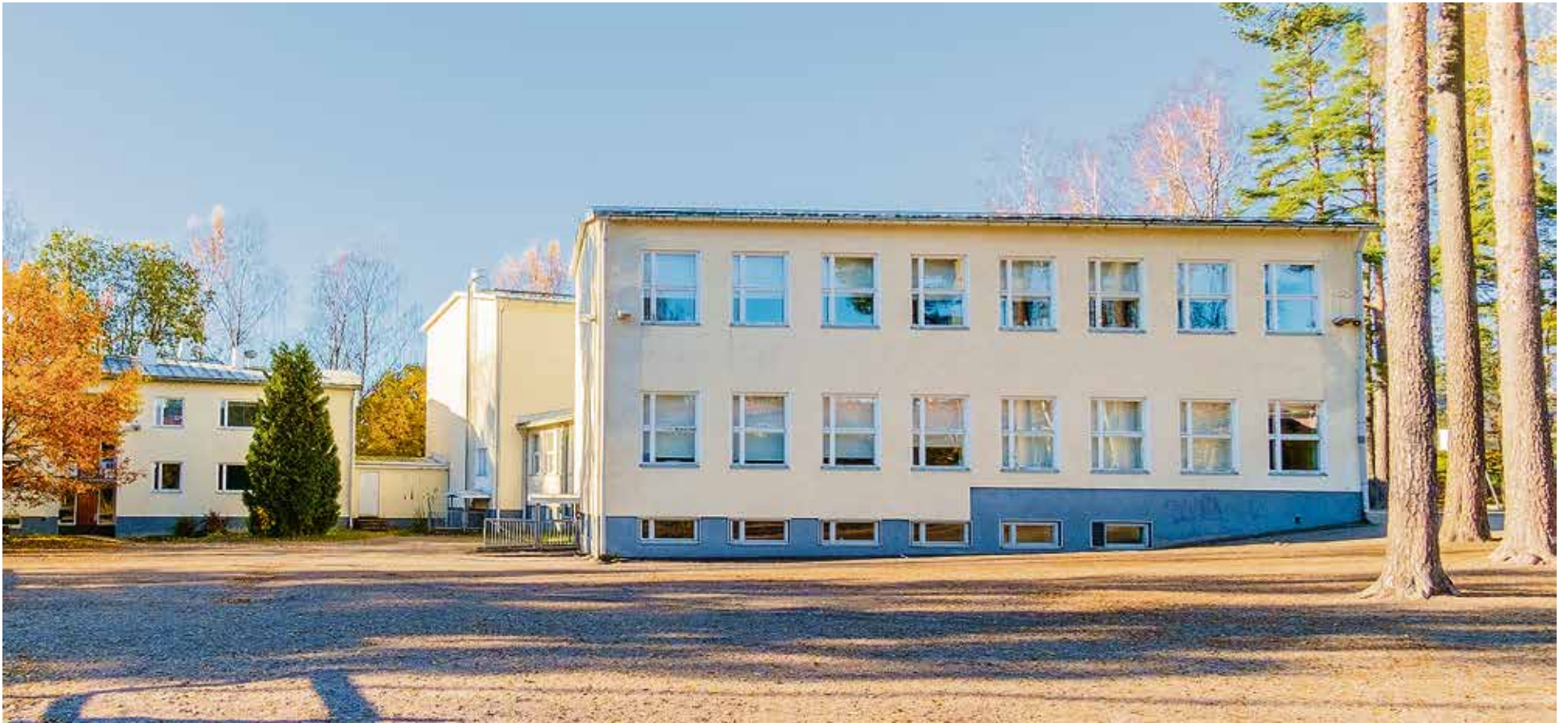
Kuva: Peter Vihra, Tuomarilan koulu.

Kaupunginhallituksen tila- ja asuntojaosto käsitteli kokouksessaan 14.8.2017 §14 Tuomarilan koulun peruskorjauksen ja laajennuksen hankesuunnitelman, päätti yksimielisesti hyväksyä sen ja ehdottaa kaupunginhallitukselle, että valtuusto hyväksyy 22.5.2017 päivätyn suunnitelman.