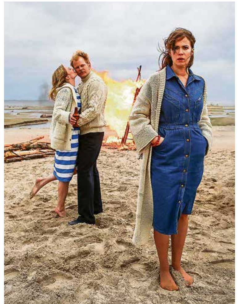
"Kaiken se kestää"

KannuKinon yhteydessä on myös kahvila Nekka, jossa ei ole vakinaista kahvilatoimintaa. Ulkopuoliset voivat vuok-