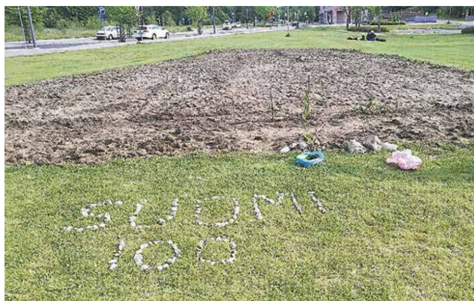
Kuva: Pirkko Kolu, Kukkaniitty

ovat olleet istuttamassa kehäkukkia ja krassia ja paikalla on ollut myös piknik-tarjoilua. Eräs asukas toi alueelle tomaatintaimet toteuttaen näin omia ideoitaan, joka on ihan sallittua ja toivottavaa. Asukkaat ja ohikulkijat ovat kiitelleet alueen kauneutta kohentavia asukkaiden aikaansaannoksia ja iloinneet siitä, että Espoon Keskuksen kaupunginosassa on nyt kukkia muiden kaupunginosien tavoin. Varsinainen kukkaniitty-seos levitetään myöhemmin syksyllä tai aikaisin ensi keväänä, joten kunnon kukkaloisto tullaan näkemään sitten ensi kesänä. Tällä hetkellä kukkanitiytyn parissa puuhailee 20 innokasta ja aktiivista asukasta, ja kylvöistä tullaan ilmoittamaan Pirkko Kolun facebook-