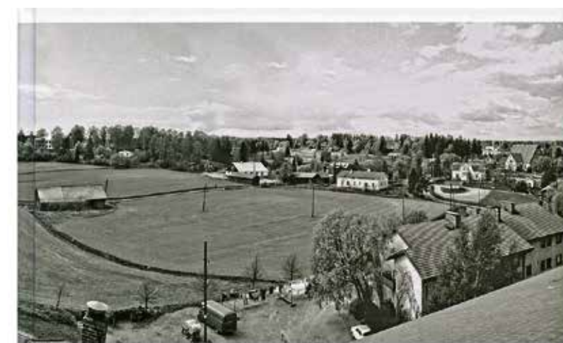
KESKI - ESPOO 45 vuotta osana kaupunkia -1970 luvulta nykypäivään