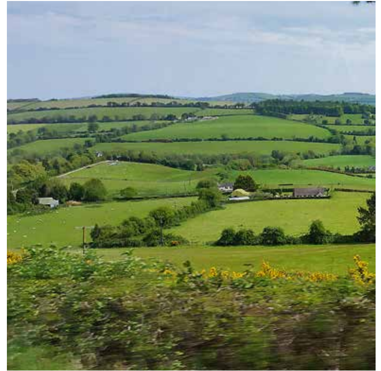
Espoon kansalliset seniorit tekivät matkan Irlantiin 18.5 - 22.5.2018