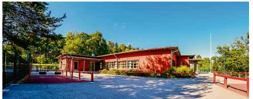
Kuvissa Kirkonkymppi, Kirkkojärven koulu ja Suvelan päiväkot