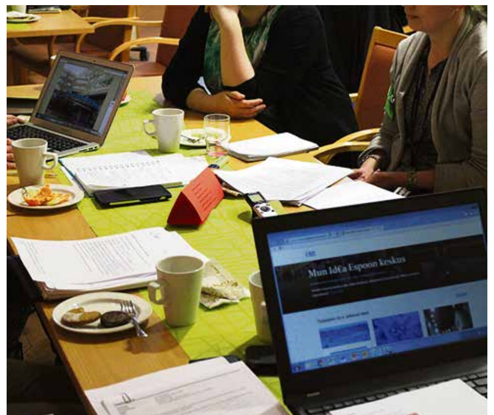
Idean työstämistä työpajassa

Onkin hyvä pohtia, miten, missä ja milloin olisi hedelmällisintä puntaroida mielipiteitä ja yhteistä hyvää osallistuvan budjetoinnin prosessissa. Mun Idea -kokeilun aikana harkittiin ja kokeiltiin monia erilaisia tapoja informoida asukkaita heidän päätöksentekonsa helpottamiseksi. Kaikille