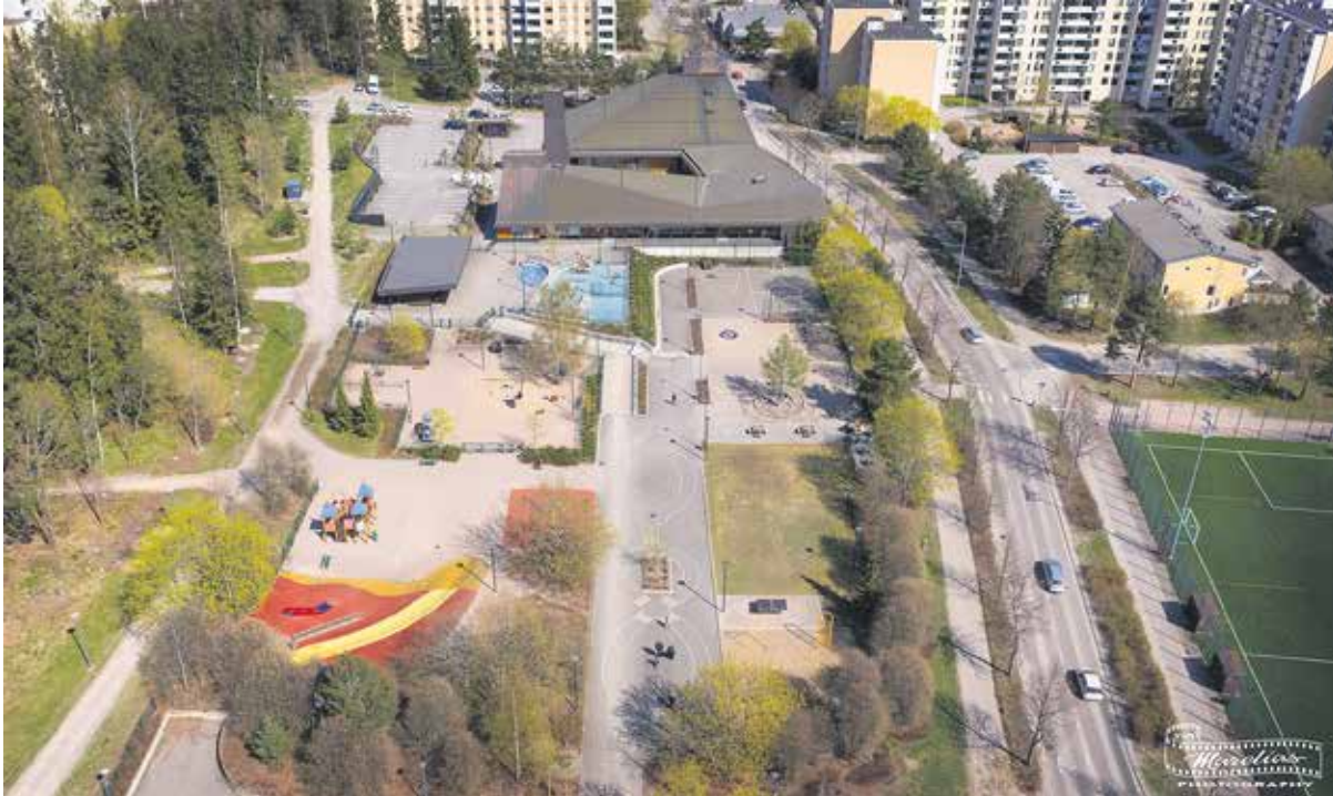
Ilmakuva Asukaspuistosta, vasemmalla kappelin vieressä varasto.