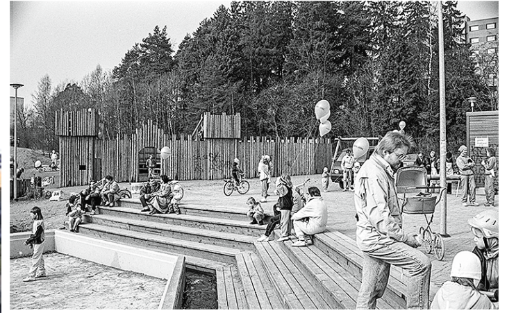
Suvelan leikkipuisto 1990-luvulla. Takana linnake ja edessä vasemmalla osa uima-allasta ja oikealla leikkipuistorakennuksen kulma.