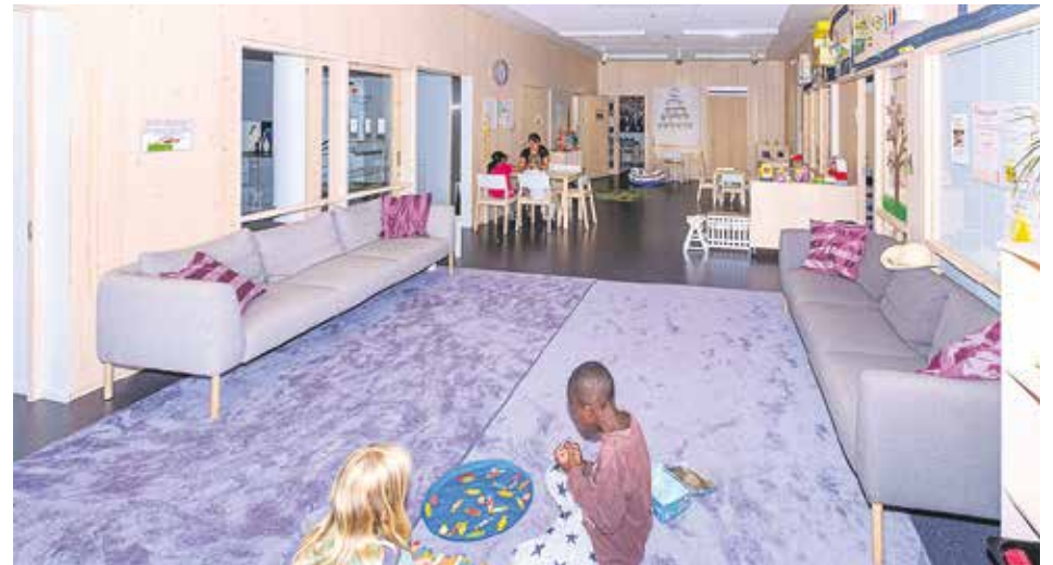
Leikkihuone sijaitsee kirkkorakennuksessa.