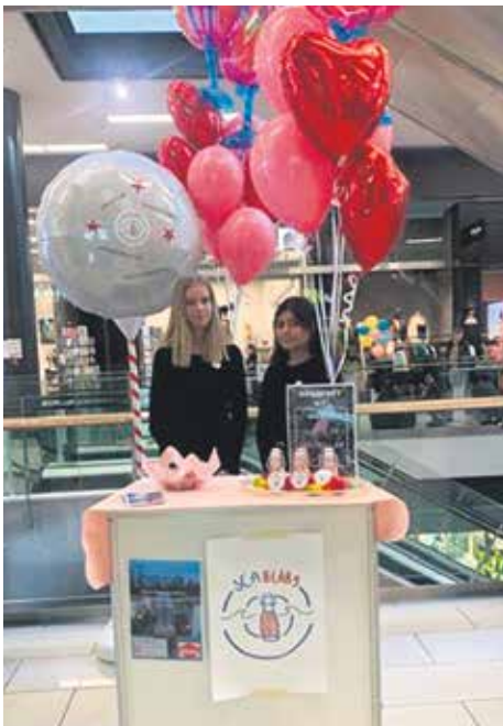
Etelä-Suomen Nuori Yrittäjä -aluekilpailu.

Erasmus+ tarjosi kansainvälisiä ystävyysyhteistyösuhteita, uusia kokemuksia ja ymmärrystä yrittäjyydestä Kirkkojärven yläkoululaisille.