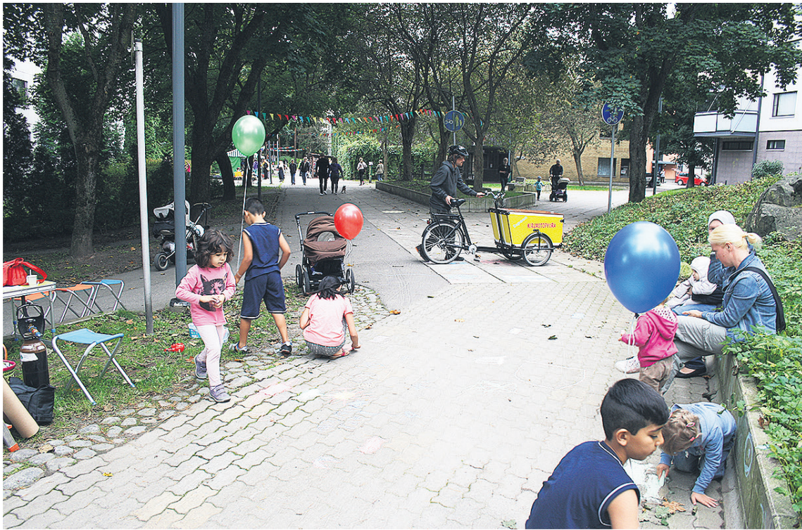
Text and foto: Kaisa Kilpeläinen

The first Suvela Bazaar on the 4th – 11th of September was a success with altogether over 2000 visitors. At least every fourth of them was an immigrant. The numbers showed that there was a need for this kind of a new urban event in the area. The next Suvela Bazaar is therefore already under planning.