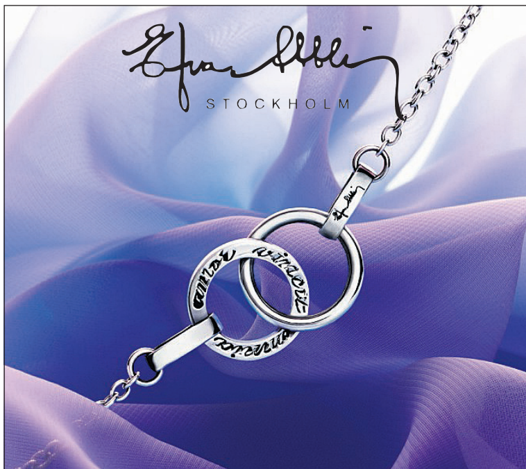
KAUNIAISTEN KELLO JA KULTA - GRANKULLA UR & GULD Promenadi 1 Promenaden, Kauniainen Grankulla puh/fax/tel: 09-5050090