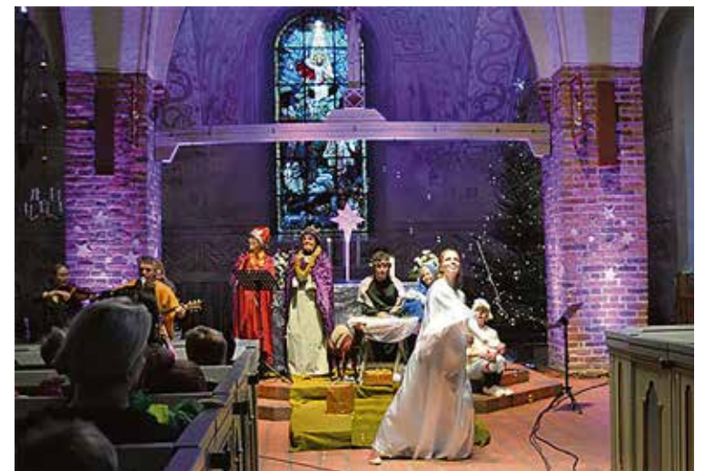
Kuva: Ihmeellinen yö-musiikkikuvaelma lapsiperheille

Osoitteita: (Espoon) tuomiokirkko, Kirkkopuisto 5. Seurakuntatalo, Kirkkoranta 2. Auroran kappeli, Heiniemenpolku 1. Kalajärven kappeli, Ruskaniitty 3. Karhusuon kallio, polku Kurutie 19 vastapäätä. Kauklahden kappeli, Kauppamäki 1. Kellonummen kappeli, Kellonummentie 13. Laaksoalahden kappeli, Ylänkötie 16. Nupurin kappeli 1, Brobackantie 1-3. Nuuksion Kattila, polku IKattilantien päätepuysäkiltä. Rinnekappeli, Rinnekodintie 6. Suvelan kappeli, Kirstintie 24. Viherlaakson kappeli, Viherkalliontie 2.