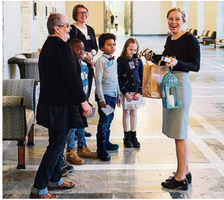
Lyhdyn luovutus Sannalle

Ensimmäisen kerran tämä tapahtuma järjestettiin vuonna 2014. Hösmärinpuiston pienten lasten koulu oli Unicef-kouluna lukuvuosina 2013-2016. Tänä aikana koulussa luotiin vahva pohja lastenoikeuksien opettamiselle. Tämä yhteinen tapahtuma oli osa lastenoikeuksien näkyväksi tekemistä. Traditioon on kuulunut myös koulun oppilaiden tervehdyskäynti Espoon kaupunginjohtajan luona.