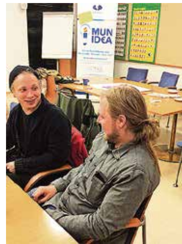
Leppoisa tunnelma, Centtifestin pojat

seen. Uutena täppänä nousi esiin vapaaehtoisten ilmoittautumismahdollisuus jo esitettyjen ideoiden toteuttamiseen. Centtifestin muusikot sanoivat, että lisäapua olisi mielellään otettu vastaan, mutta hyvin selvisivät kuitenkin tämän kesän keikasta.