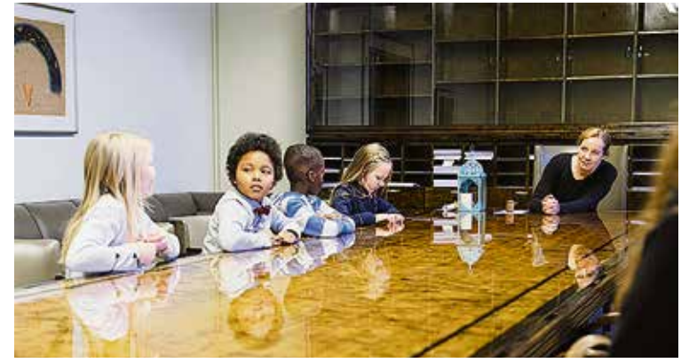
Koululaiset valiokunnan huoneessa