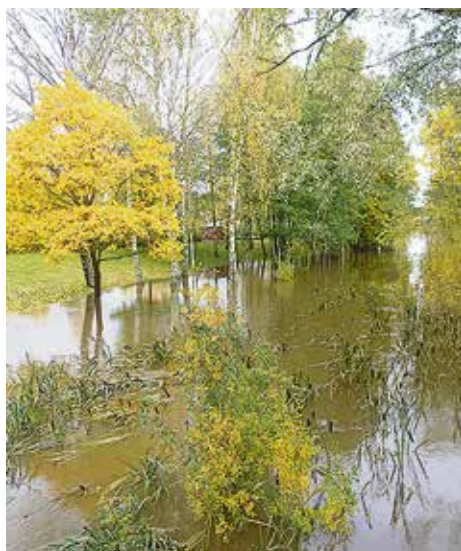
Kävelysilta tuomiokirkon kohdalla

taan jo uutta tietä ja etelään vanha tiepuolisko. Tilapäiset kaistat tulevat jälleen käyttöön ensi vuonna, kun vastaava korotus tehdään eteläiselle puoliskolle. Turunväylän urakan hinta on n 11 miljoonaa euroa; sen lisäksi tulee mm uuden kevyen väylän ylikulkusillan kustannukset, 2-3 miljoonaa, joka jää Espoon maksettavaksi.