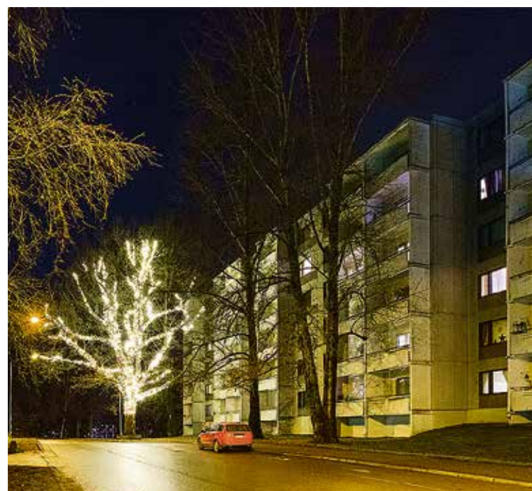
Suvelan (Kirstinmäki 7) 150-vuotias rauhoitettu tammi valaistuna.

Puh. 040 865 2534 | kirppiskahvio@gmail.com