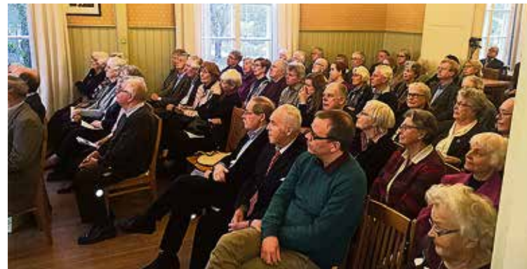
Seminariet samlade 87 åhörare.