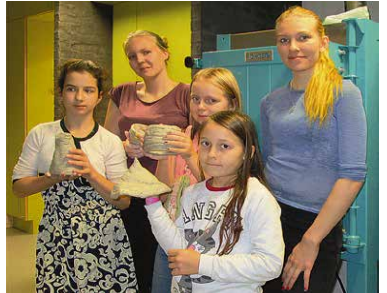
Kerholaiset tykkäävät muovata omin käsin.

Suvelan kappelissa kokoontuu viikottain runsaasti varhaisnuorten kerhoja moneen lähtöön. Löytyy niin legorobotti- ja keppihevosharjoitusta, kuin musiikki-, kokki- ja kädentaitokerhoakin. Syksyllä seurakunnan varhaisnuorten toimintaan ilmoittautui yli 600 koululaista. Vapaaehtoisia nuoria ja aikuisia kerhon ohjaajia on melkein sata.