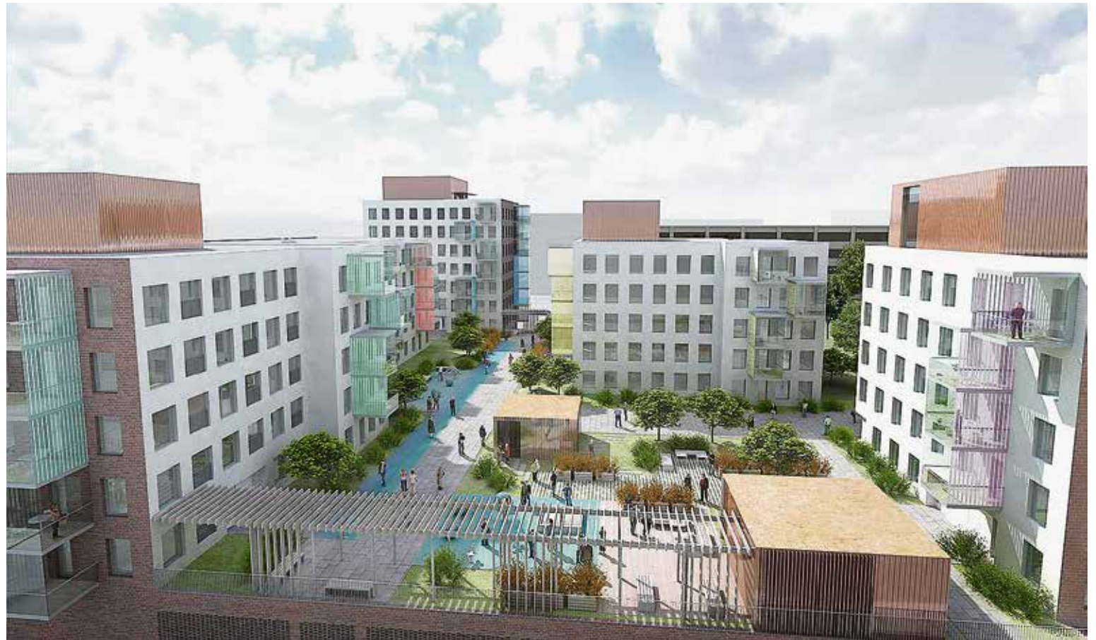
Havainnekuva: A6 Arkkitehdit Oy

Laajemmin kilpailuasiakirjoissa korttelia ympäröivää Espoon keskusta kuvattiin historialliseksi, hengelliseksi ja hallinnolliseksi keskuksiksi, joka kasvaa ja kehittyy