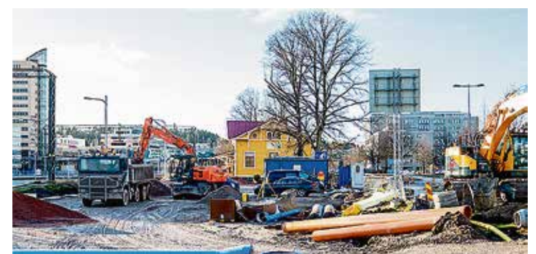
Liityntäliikenteen paikoituspaikkoja rakennetaan.

Alueelle on tarkoitus toteuttaa vapaarahoitteisia omistusasuntoja. Asuntojen myyntihinnan tavoitetasoksi arvioidaan 4 500 €/m 2 . Varaussopimuksen ehtona on, että asuntorakennusoikeudesta vähintään 50% tulee