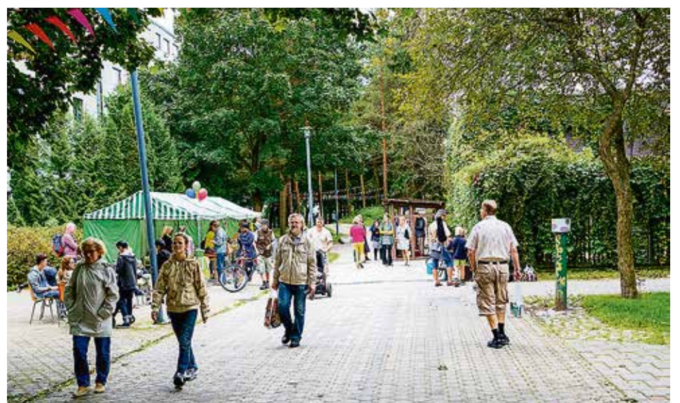
Suvelan Basaari Kirstinharjulla vuonna 2016.