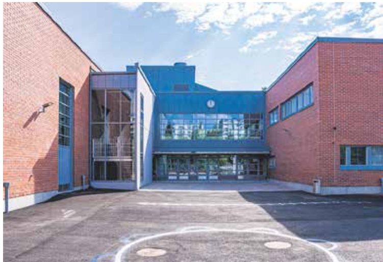
Kirstin koulu, Kirstintie 11.

Sentterissä nuorella on mahdollisuus kohdata turvallinen ja kuunteleva aikuinen sekä ikäisiään kavereita. Nuorisotilassa on toimintaa 3 - 7 -luokkalaisille lapsille ja nuorille. Nuorisotila on auki