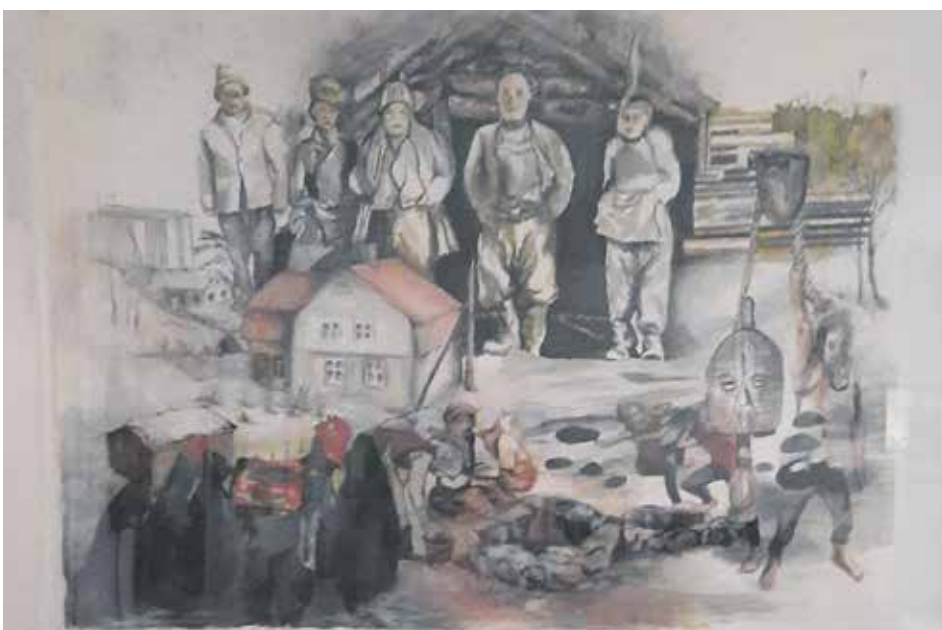
Akvarellin koko 60 x 90 cm.

Kirjoita lisätietoihin nimesi, osoitteesi ja puhelinnumerosi