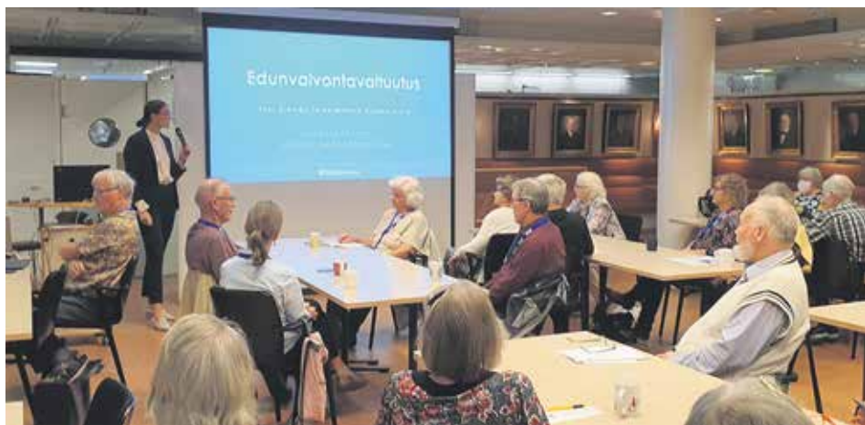
Seniorit jäsentapaamisessaan valtuustotalolla

Teksti: Tuula Nordström